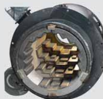
Arimax BioJet T arinanhoitotangoilla