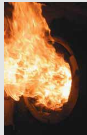
Arimax BioJet käytössä